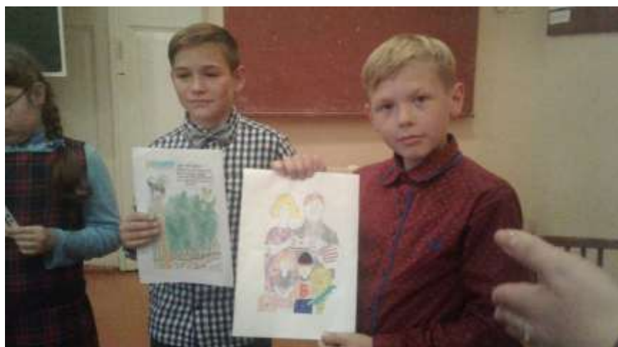
Поделка «Репка» 7 класс

Поделка из электрической лампочки «Снеговик»