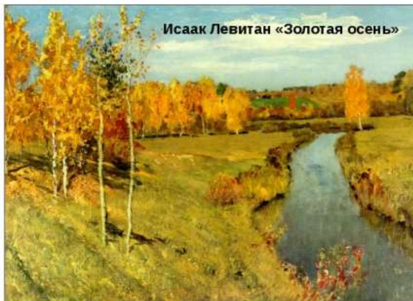
Исаак Левитан «Золотая осень»

Вот и лето прошло Мне так грустно и странно Но зачем же грустить? Ведь и осень прекрасна! Скоро яркий наряд Все оденут деревья, И поднимется сразу У меня настроение. Как прекрасны в саду Наши яблоки, груши! Вот и осень пришла, Как её не послушать?! Перед снежной зимой Это отдых природе. Будем рады всегда Этой чудной погоде!